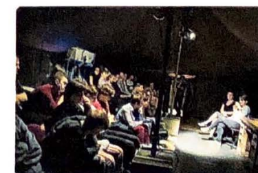
Diskuse po představení