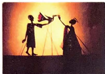
Programy pro děti