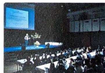
Slavnostní setkání vietnamské komunity