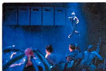
Divadlo a nový cirkus