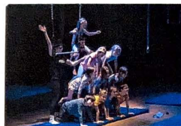
Kurzy pro děti