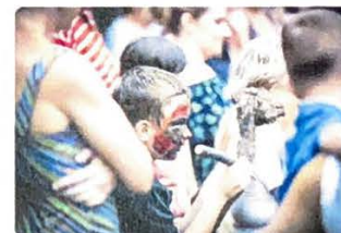
Letní kreativní tábor pro děti