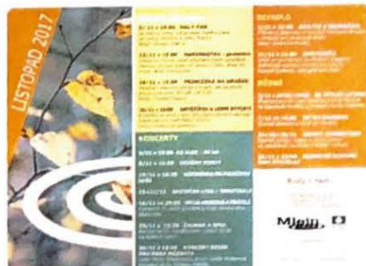
Ukázka propagačních materiálů

V rámci komunikace s publikem byly rozesílány newslettery na základě objednávky této služby návštěvníky. Novým komunikačním kanálem se školami v obvodu Prahy 13 a okolních městských částí se staly speciální newslettery, které mají pozitivní ohlas u pedagogů. V roce 2017 byla nadále výroba vlastních tiskovin omezena na měsíční programy, přehled pohádkových programů a plakáty na vybrané jednotlivé programy. Pořizování fotodokumentace se zaměřuje na vybrané akce.