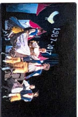
30 let folklorního souboru Lučnicka