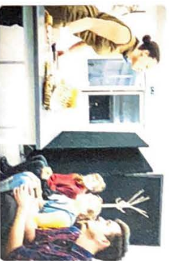
Ukázky různého využití vění sálu a dalších prostor budovy