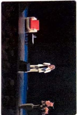
Programy pro seniory